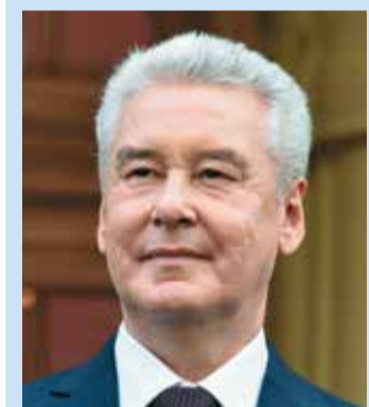
Мэр Москвы Сергей Собянин

«Газовое хозяйство Москвы – это важная инфраструктурная составляющая, от которой зависит надежное функционирование всего городского хозяйства. За последние годы «МОСГАЗ» прошел огромный путь: реконструирует магистральные сети, разводящие сети, ГРП, узлы управления, оперативные службы», – Мэр Москвы С.С. Собянин.