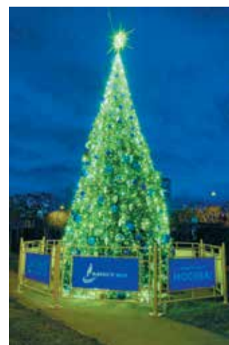
Елка на Мичуринском проспекте