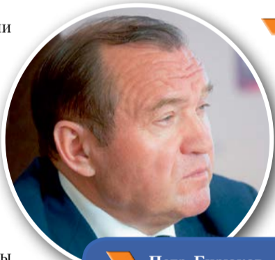
Петр Бирюков, заместитель мэра Москвы в Правительстве Москвы по вопросам ЖКХ и благоустройства

Для организации работ на местах и контроля за их выполнением в каждом округе Москвы были созданы специальные комиссии. В их состав вошли представители префектур и управ районов, управляющих компаний, специалисты МОСГАЗа, Мосжилинспекции, Департамента по делам гражданской обороны, чрезвычайным ситуациям и пожарной безопасности Москвы и ГУ МЧС России по Москве. На информационных стендах рядом с многоквартирными домами размещают информацию о проведении обследования.