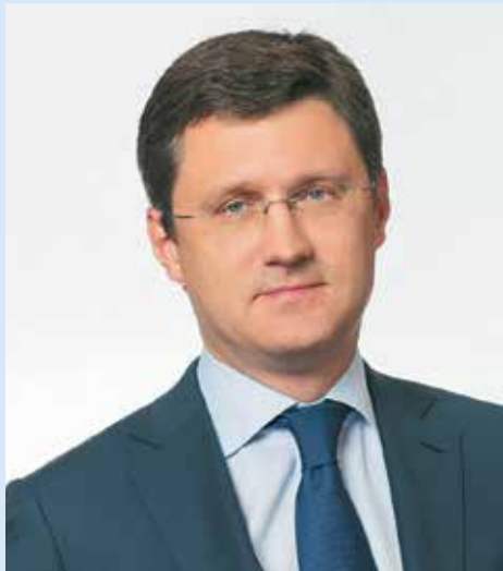
Министр энергетики Российской Федерации А.В. Новак

Желаю вам успехов в работе и высоких результатов в реализации перспективных проектов газовой отрасли.