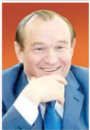
Заместитель Мэра Москвы в Правительстве Москвы П.П. Бирюков