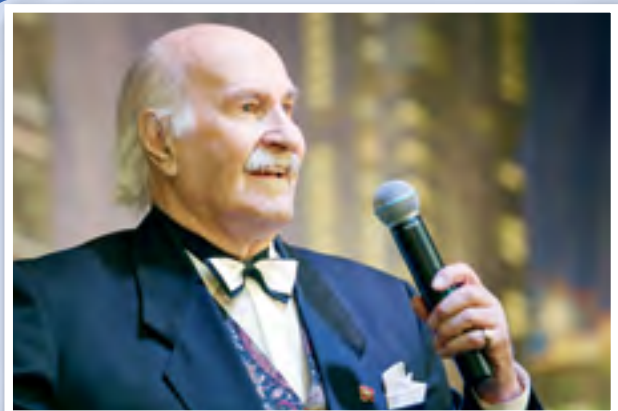
Владимир Михайлович Зельдин

Многие удивляются, как в такие годы можно сохранить ясный ум, и еще работать. Владимир Михайлович охотно делится секретом: он по-прежнему ведет здоровый образ жизни - не пьёт, не курит. И со спортом дружит. Уже в преклонном возрасте, на кинофестивале в Сочи он купался в море, когда температура воды едва доходила до 15 градусов. Даже его молодые коллеги не рискнули сделать этого, а Владимир Михайлович, как заправский морж, нырял, плавал, затем ещё делал на берегу зарядку. Но мы знаем еще один секрет Владимира Михайловича – он молод душой! И нам очень приятно, что этот великий артист, ветеран сцены, сегодня в одном строю с ветеранами МОСГАЗа!