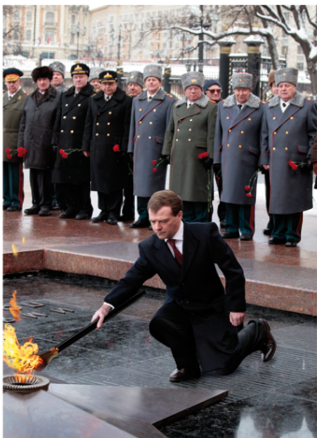
2010 год. Дмитрий Медведев

Теперь в Москве будет два Вечных огня. У Кремлевской стены и на Поклонной горе - Огонь Памяти и Славы. Так городские власти решили ознаменовать 65-летие со Дня Победы. Вечный огонь обретает вторую жизнь и дополнительное место прописки. Но, как и в прежние годы, главным хранителем неугасающего огня, символа памяти и скорби по погибшим в Великой Отечественной войне, остается ГУП «МОСГАЗ».