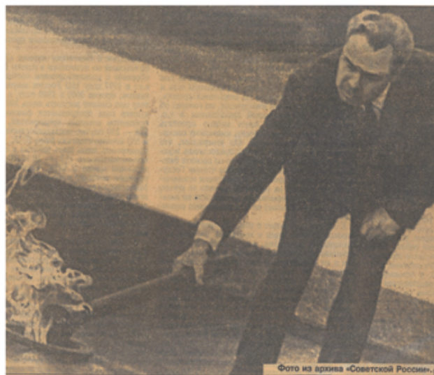
1967 год. Леонид Брежнев

После окончания ремонтных работ огонь вернули на его историческое место возле Кремлевской стены. Эта церемония по своей значимости напоминала события далекой давности. Когда в 1967 году Вечный огонь в Александровском саду зажгли впервые.