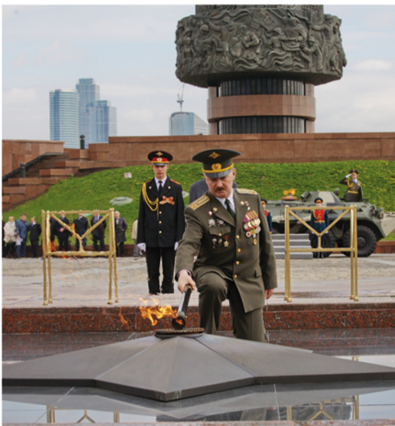
2010 год. Огонь Памяти и Славы на Поклонной Горе зажигает герой России Вячеслав Сивко

История Вечного огня у Кремлевской стены продолжила свой отсчет после короткого перерыва, а на Поклонной горе всё только начинается.