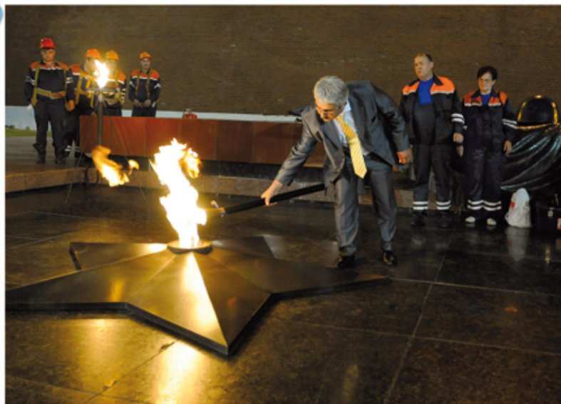
2009 год. Генеральный директор ГУП «МОСГАЗ» возвращает Вечный огонь с временной горелки на его законное место

Брежневский факел, как и горелка Вечного огня, были изго-