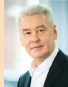
Мэр Москвы Сергей Собянин