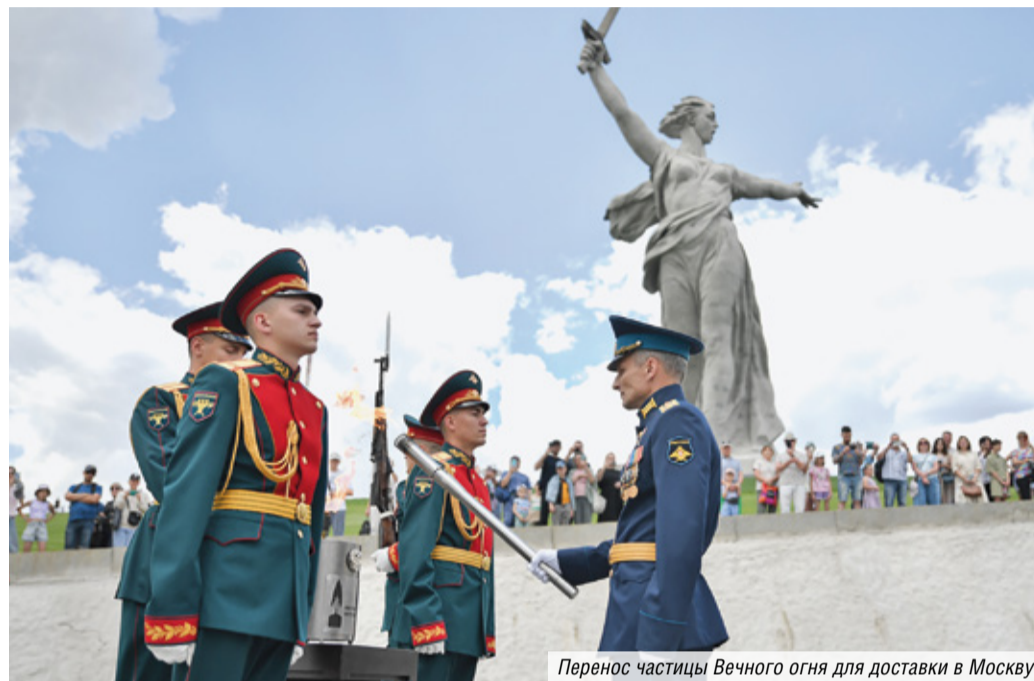
Перенос частицы Вечного огня для доставки в Москву

В сопровождении специалиста АО «МОСГАЗ» частицу пламени Вечного огня от памятника-ансамбля «Героям Сталинградской битвы» на Мамаевом кургане в Волгограде доставили бортом военного ведомства в переносной газовой лампаде в Главный храм Вооруженных сил Российской Федерации для проведения мемориальной акции «Свеча памяти».