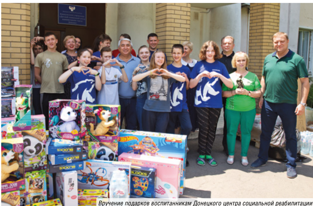
Вручение подарков воспитанникам Донецкого центра социальной реабилитации