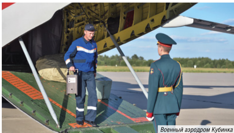
Военный аэродром Кубинка