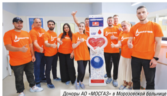
Доноры АО «МОСГАЗ» в Морозовской больнице