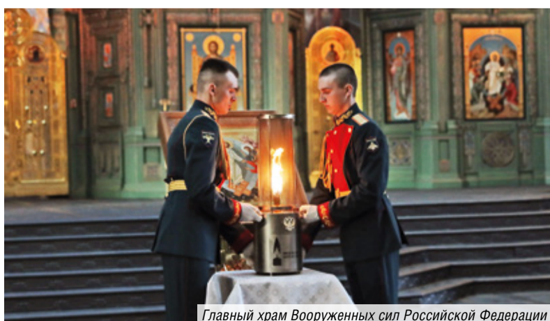
Главный храм Вооруженных сил Российской Федерации