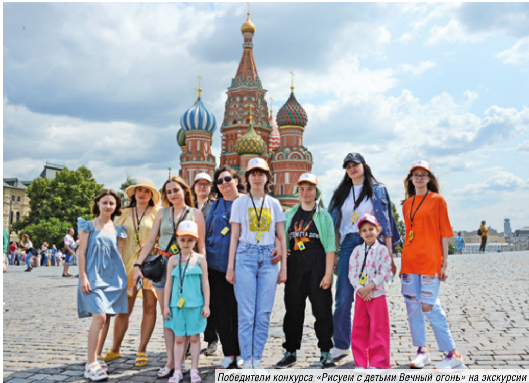
Победители конкурса «Рисуем с детьми Вечный огонь» на экскурсии