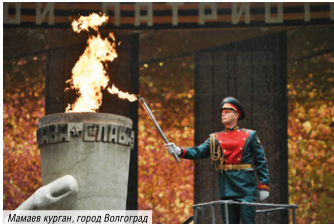
Мамаев курган, город Волгоград