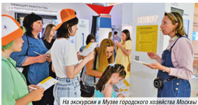
На экскурсии в Музее городского хозяйства Москвы