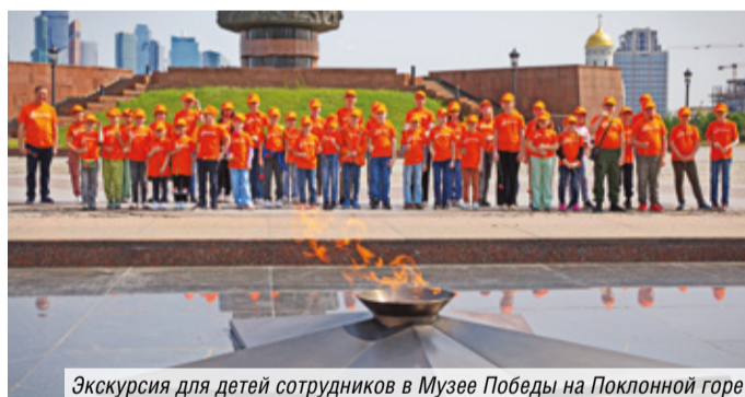
Экскурсия для детей сотрудников в Музее Победы на Поклонной горе