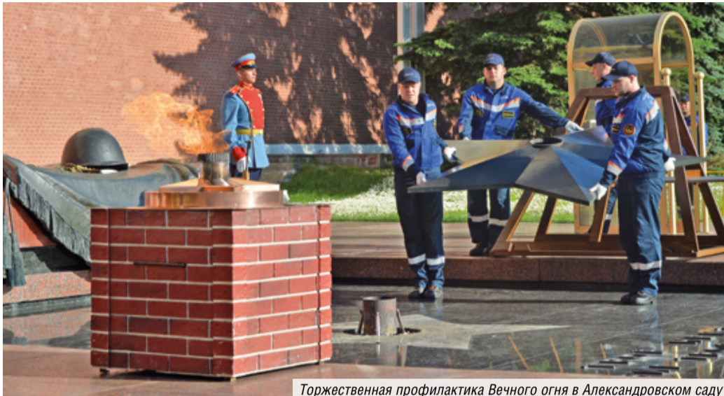
Торжественная профилактика Вечного огня в Александровском саду